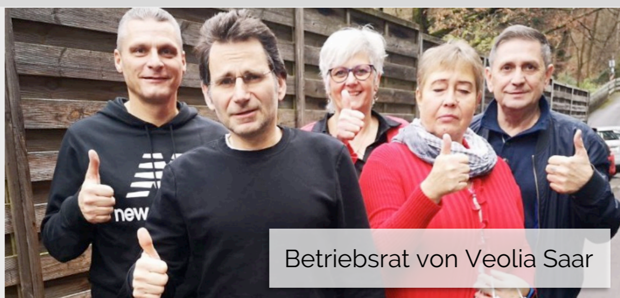
Betriebsrat von Veolia Saar

Bei vielen Beschäftigten in der Gebäudereinigungsbranche bestehen große Entwicklungsmöglichkeiten. Das gilt insbesondere für die zahlreichen weiblichen Beschäftigten und Beschäftigte mit Migrationsgeschichte. Häufig gibt es bereits