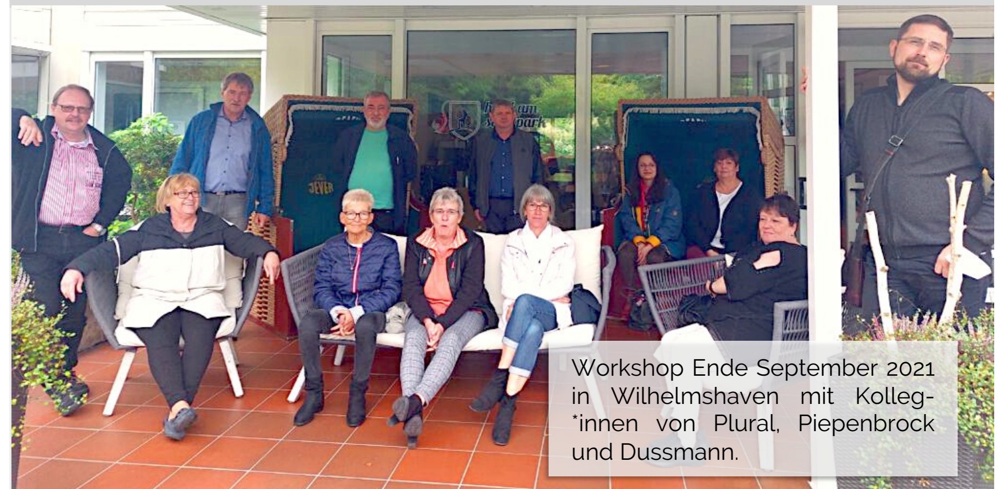
Workshop Ende September 2021 in Wilhelmshaven mit Kolleg*innen von Plural, Piepenbrock und Dussmann.